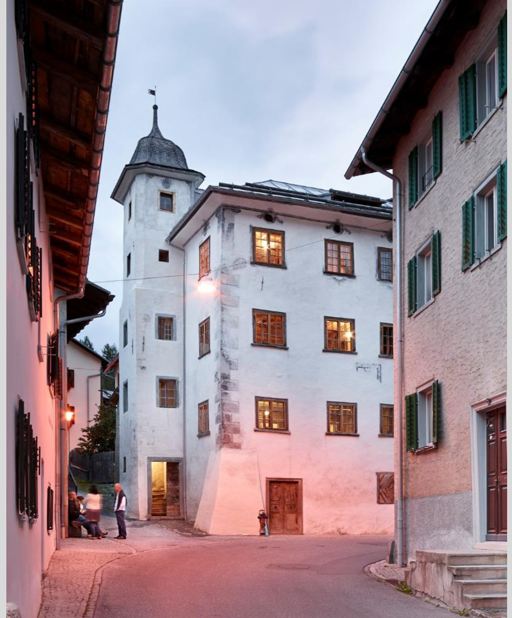
Türelhus, Valendas, GR (avant/après assainissement)