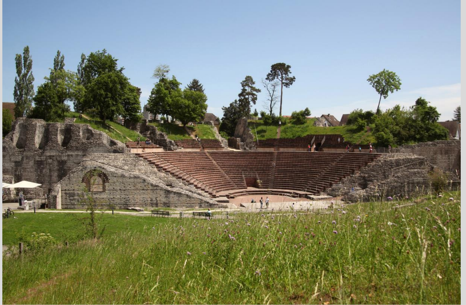
Ville romaine d'Augusta Raurica, Augst BL