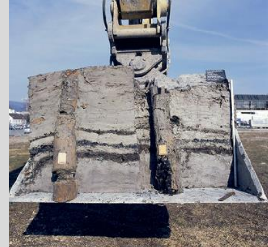
Sondages avec pelle mécanique