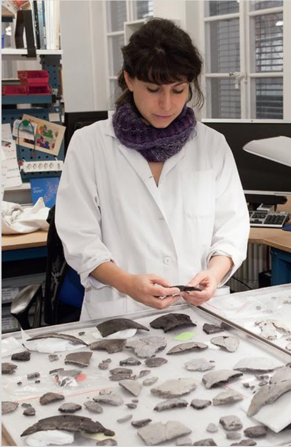
Restauration de céramiques néolithiques