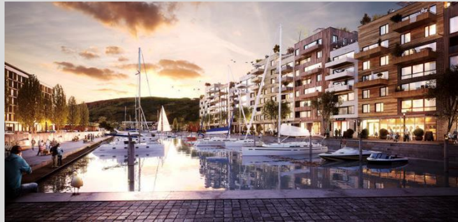
Projection ensemble immobilier Agglolac