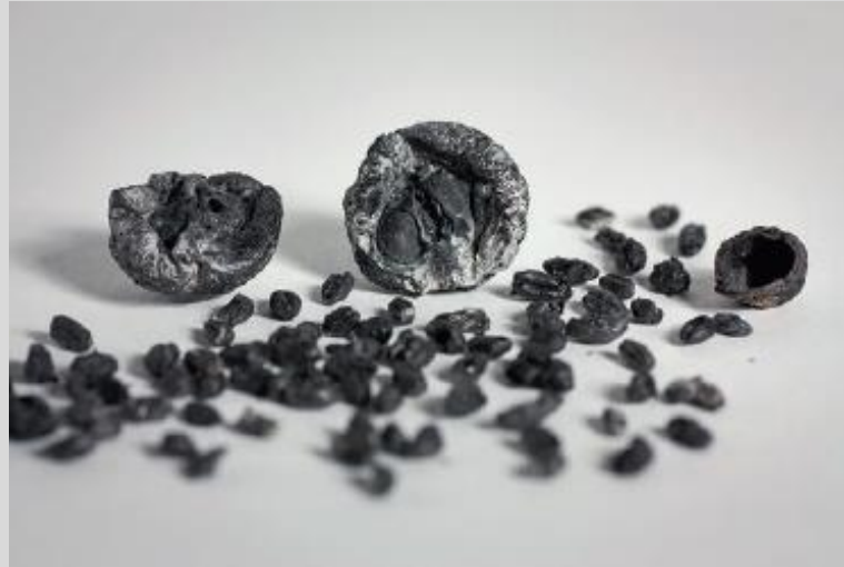
Pommes sauvages, grains de céréales et coquilles de noisettes dont la conservation est très exigeante